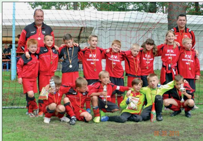
die Siegermannschaft des OSV