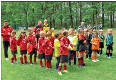
Mannschaften des F-Jugendturnieres