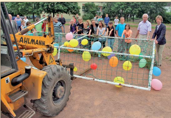
Symbolischer Baustart Sportanlage Mittelschule am Steegenwald