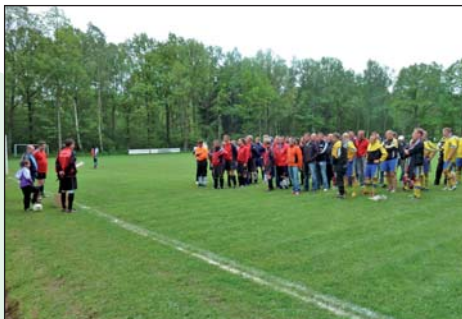
Siegerehrung Alte Herren