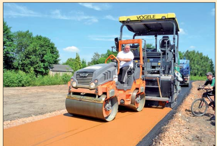
Asphaltarbeiten am Radweg