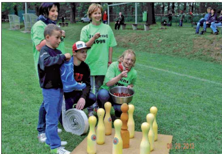
die Frauenmannschaft beim Triathlon