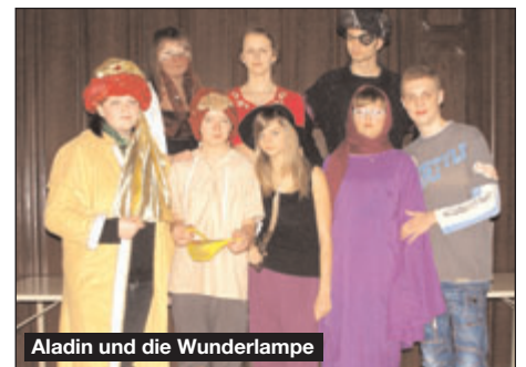
Aladin und die Wunderlampe

es erfahren und dürfen sich außerdem noch auf zwei sprechende und sich ständig zankende Schafe sowie auf eine Klobürstenhändlerin freuen. Nach einer gemütlichen Pause in der Cafeteria bei einem leckerem Stück selbstgebackenen Kuchen und einer Tasse Kaffee oder Tee reisen die Mimen sowie das Publikum in den Orient zum musikalischen Spektakel „Aladin und die Wunderlampe“ (Tausendundeine Nacht/ E.