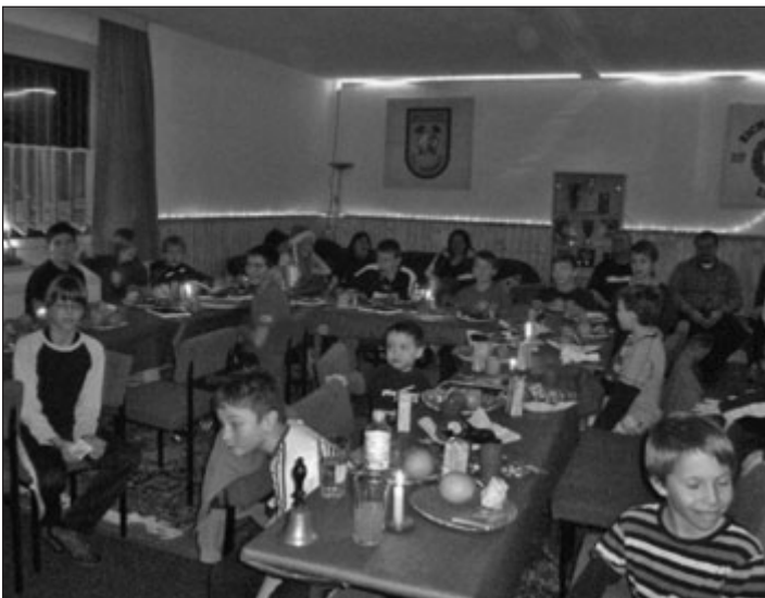
Gespannte Kinder bei der Geschenkeausgabe

Ich möchte nicht die einzelnen Kämpfe ausführlich beschreiben, da diese schon dem vergangenen Jahr angehören. Heute berichte ich über die Weihnachtsfeier der Ringerkinder und was in diesem Jahr im Ringerverein 1908 Eichenkranz Lugau e.V. alles so ansteht. Unsere Ringer, vom Kleinsten an bis hin zur Jugend, haben in diesem Jahr gute und auch sehr gute Leistungen gezeigt. Ein Belohnung gab es hierfür am 17.12.2010 zur alljährlichen Weihnachtsfeier. Wie immer war am Anfang der Schweiß gesetzt, der beim Tauziehen und Fingerspielen auf der Ringermatte floss. Dieses Jahr wurden auch die Eltern mit auf die Matte gebeten, welche das Angebot zahlreich annahmen und ihrem sportlichen Talent freien Lauf lassen durften. Somit hieß es bei fast allen Spielen „Kinder gegen Eltern“. Es gab viel zu Lachen wenn der ein oder andere Pulzelbaum, nicht immer nur von den Kindern, geschlagen wurde. Bevor zu Äpfel, Plätzchen und Süßem gegriffen werden durfte, wurde noch eine Runde in der Spielhalle gekickt. Unsere ehrenamtlichen Helfer (bei denen sich der Präsident für die geleistete Arbeit bedanken möchte) hatten wieder alles schön vorbereitet, den Vereinsraum weihnachtlich geschmückt, mit Kerzen und Rachermannln und für jedes Kind einen bunten Teller vorbereitet. Vielen Dank nochmals für die Spenden des REWE Marktes aus Lugau. Dann trat der Weihnachtsmann in den Raum und hatte einen riesengroßen Sack voller Geschenke mit. Eigentlich waren es ja zwei.