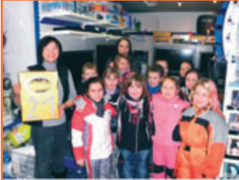
21. Dezember Das 21. Adventfenster steht im TV-Fachgeschäft Mehner (Obere Hauptstraße). Beschenkt wurde der Hort an der Lugauer Grundschule mit einem CDMP3-Player für die Freizeitgestaltung.