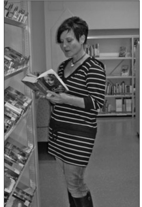
Was erwartet Sie 2011?

chen mit allen Sinnen erleben. Sie durften unter anderem den Ball vom Froschkönig ertasten, die Lebkuchen von Hänsel und Gretel kosten und viele Märchen waren von der Märchenfrau zu hören.