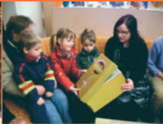
4. Dezember Am 4. Dezember durften die Kinder der Familie Kramer das Fenster des Adventskalenders in der Lugauer Stadtbibliothek öffnen. Erhalten war symbolisch ein Paket mit Kinderbüchern.