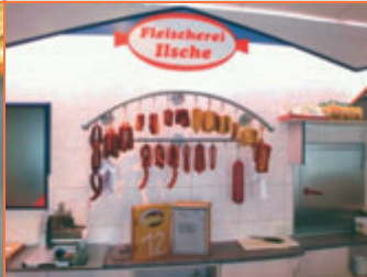
12. Dezember Das 12. Fenster steht in der Fleischerei Ilse (Fockestraße). Ob wohl in diesem Jahr am Weihnachtabend "Weiße Flocken" keine Haseln, wie es in dem Gedicht in diesem Fenster heißt?