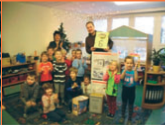
6. Dezember Am Nikolausfest erhielt der Kindergarten "Sonnenskeller" von der Lugauer Volkshochschule Riga Heibel einen Wäschetrockner geschenkt. Übergeben wurde das Geschenk gleich im Kindergarten.