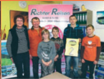
2. Dezember Das Reiseunternehmen Richter Reisen (Poststraße 1) übergibt kleine Geschenke an die Nachwuchslerger des Ringvereins "Eichenkranz" Lugau.