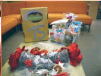
15. Dezember Das Fenster mit der Nummer 15 steht in der Villa Facius. In der Lugauer Stadtbibliothek wurde einer Lugauer Familie mit mehreren Kindern ein Paket mit Büchern geschenkt.