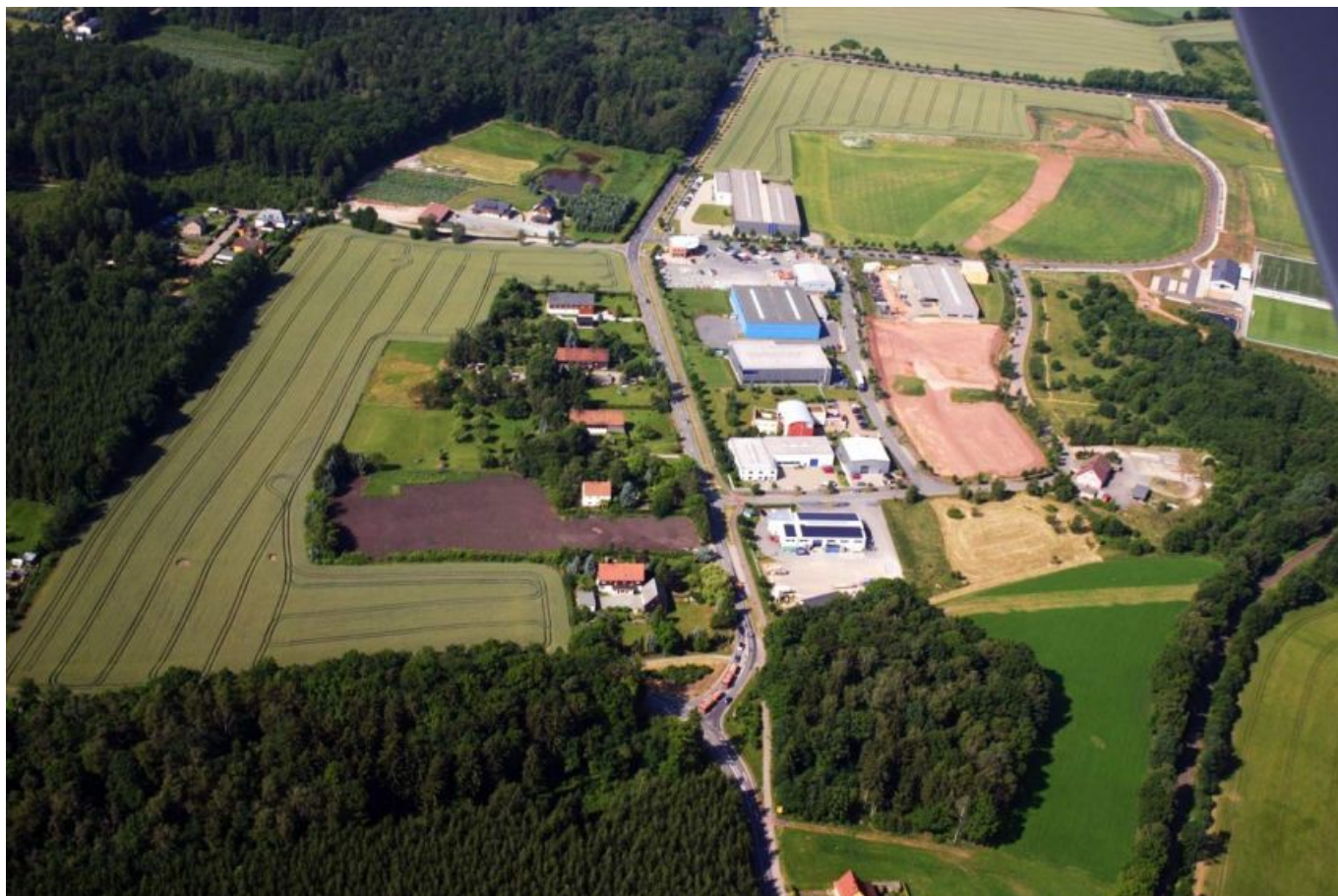
_ Luftbild vom Gewerbegebiet "Hoffeld"

Hier geht es zur offiziellen Onlinepräsenz vom Gewerbegebiet Hoffeld