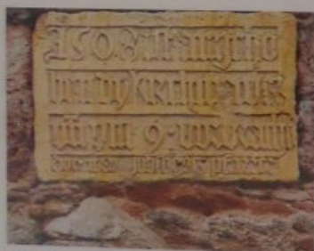
1508 ist angeho ben dy kirchmauer vn ym 9 vorbracht dyzeit Er jobst götz pfarrer