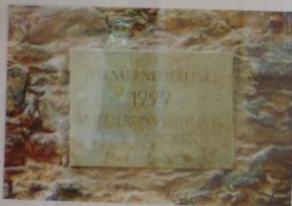
TURMERNEUERUNG 1999 WIEDEREINWEIHUNG DER GLOCKEN

Erst nach der Wende 1999 wurde der alte Glockenturm von Grund auf rekonstruiert und erhielt seine Glocken wieder.